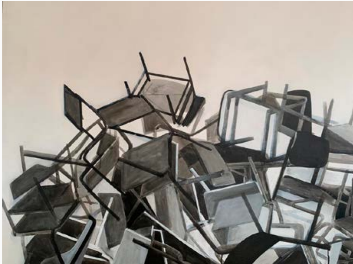
Antiborramiento Martha Rivero 100 cm x 130 cm Tinta acrílica sobre tela $ 6 MM 2023