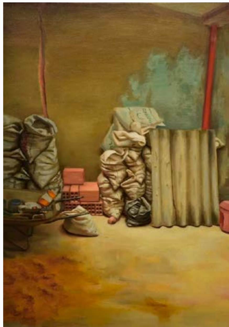
Tiempo Angie Vega Óleo sobre lienzo 70 cm x 50 cm $ 7,5 MM 2022