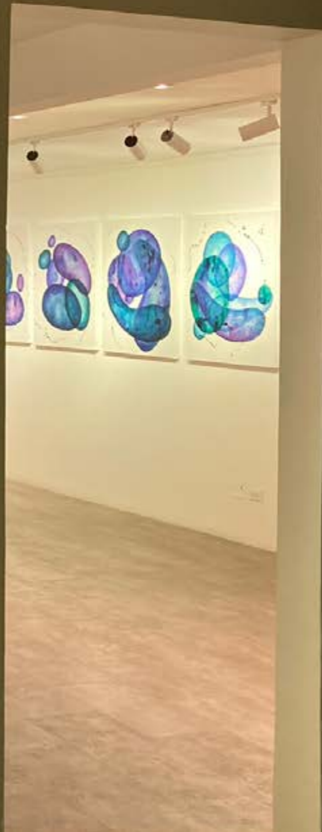
Small white label with illegible text.