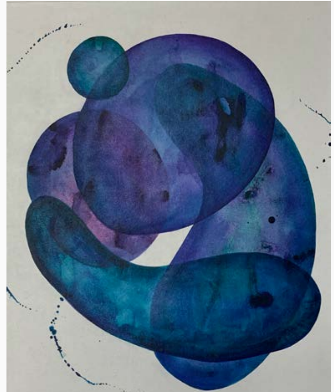
"Serie Serendipia" #3 Claudia Serrano Zv Acrílico sobre lienzo 100 cm x 80 cm $ 4 MM 2023