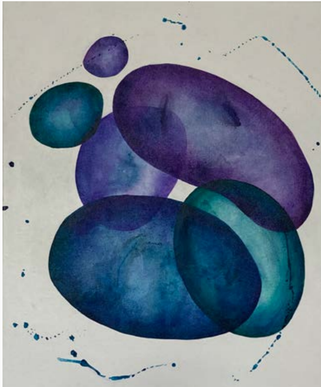
"Serie Serendipia" #2 Claudia Serrano Zv Acrílico sobre lienzo 100 cm x 80 cm $ 4 MM 2023