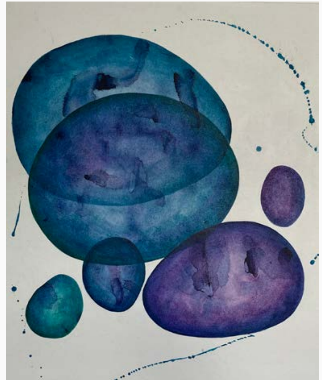
“Serie Serendipia” #1 Claudia Serrano Zv Acrílico sobre lienzo 100 cm x 80 cm $ 4 MM 2023