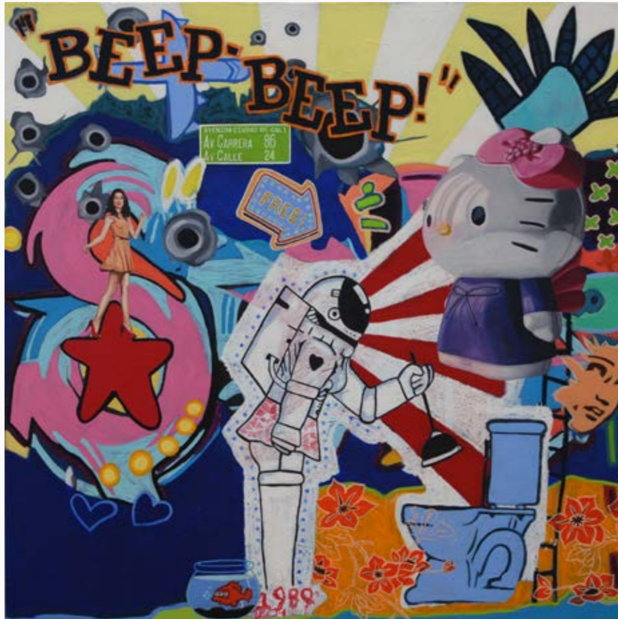
beep beep Boris Pérez Óleo sobre tela 120 cm x 120 cm $ 20 MM 2012