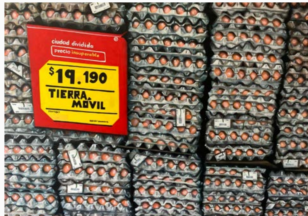
Vitrinas tierra movil Oscar Villalobos Acrílico sobre lienzo 70 cm x 100cm $ 9 MM 2023