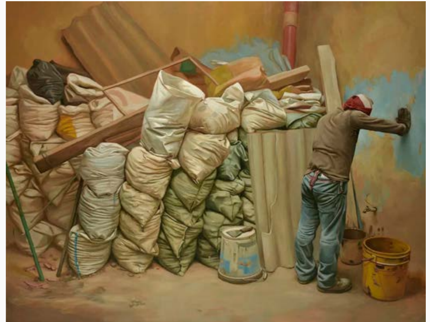
Emmendar Angie Vega Óleo sobre lienzo 65 cm x 175 cm $ 35 MM 2023