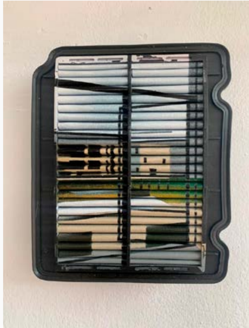
Vista a través de la ventana VI Martha Rivero 25 cm x 15 cm Tinta acrílica sobre tela de filtro $ 2,5 MM 2023