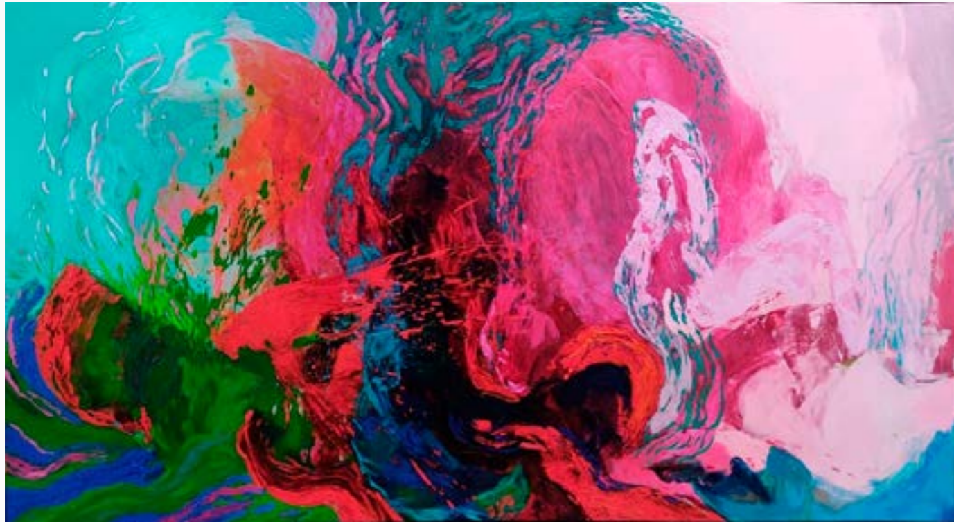
Sin título Walber Pérez Óleo sobre lienzo 120 cm x 220 cm $17 MM 2019