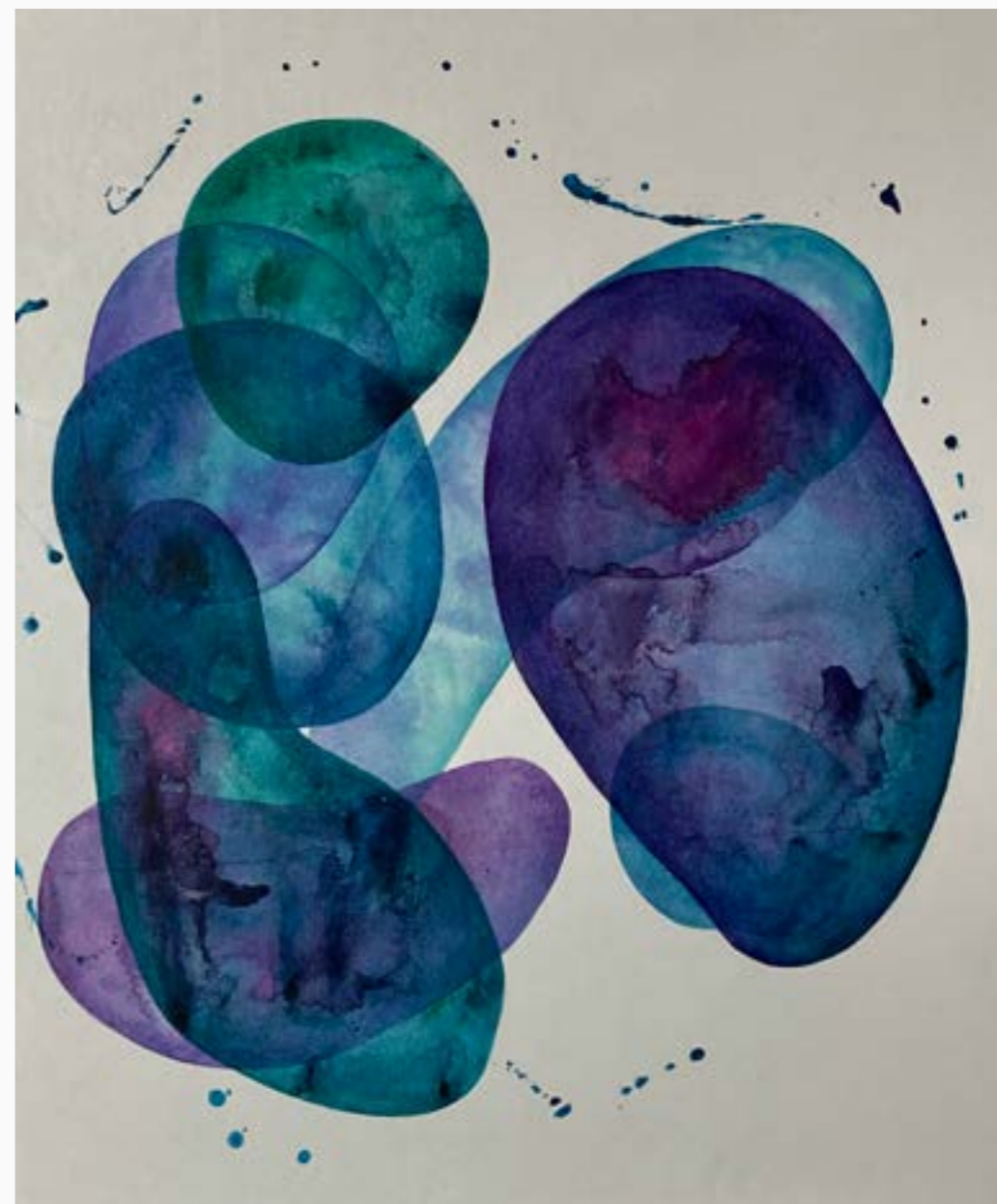
"Serie Serendipia" #5 Claudia Serrano Zv Acrílico sobre lienzo 100 cm x 80 cm $ 4 MM 2023