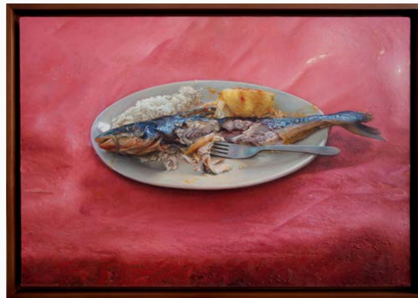
Mandorla Juan Camilo Barón Óleo sobre tela 50 cm x 70 cm $ 6 MM 2019