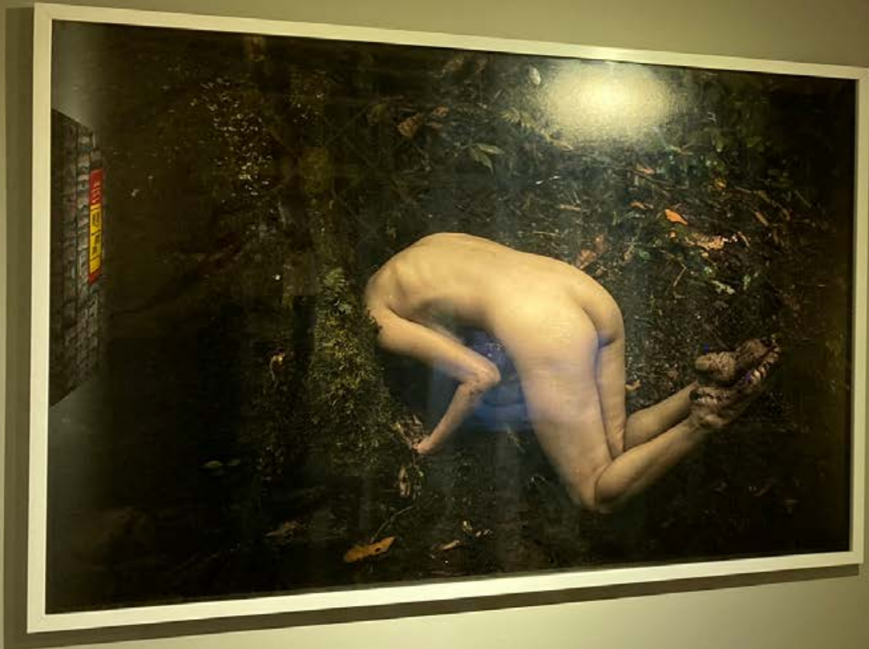
Small white label with illegible text.