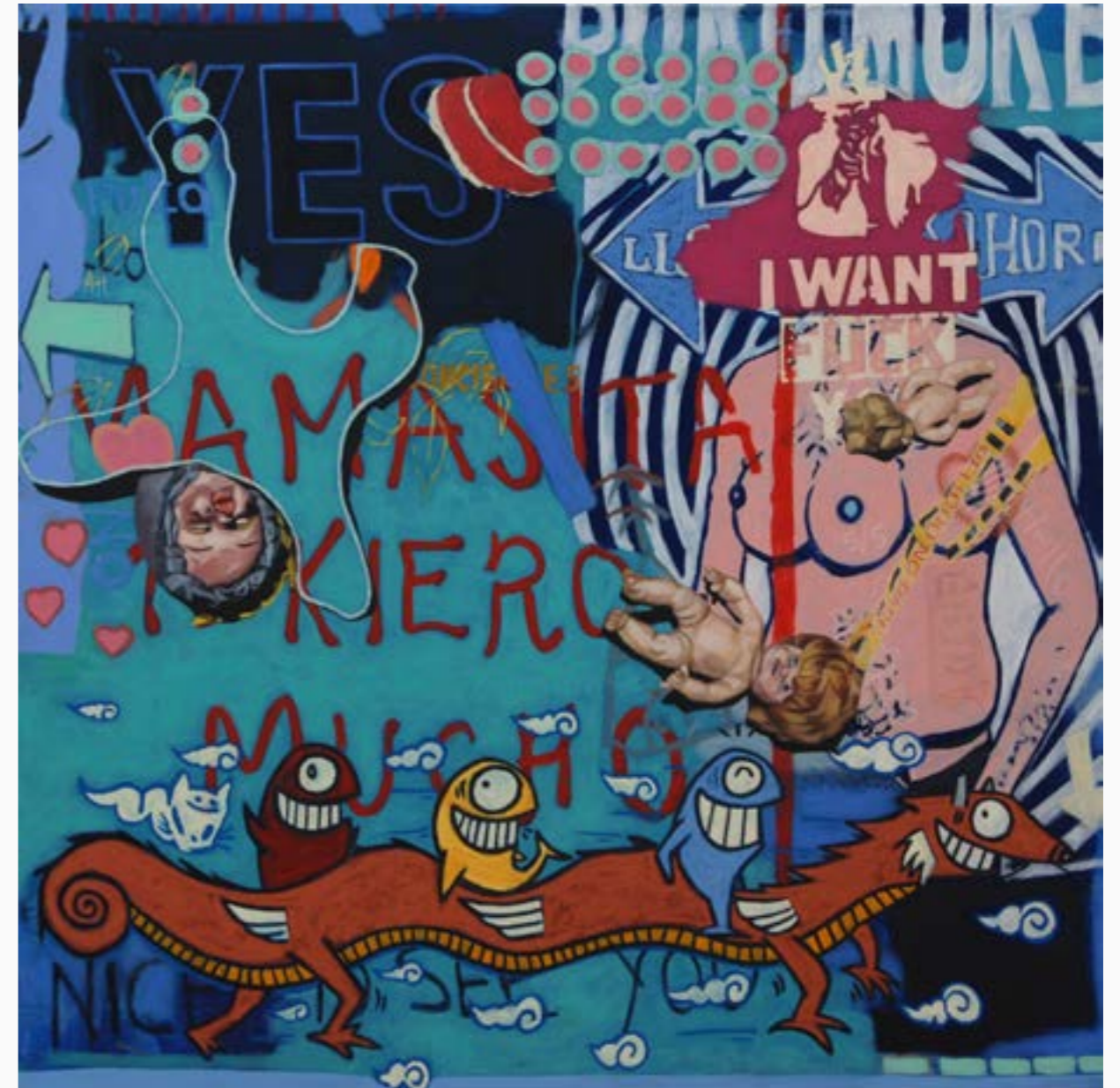
Mamasita Boris Pérez Óleo sobre tela 120 cm x 120 cm $ 20 MM 2012