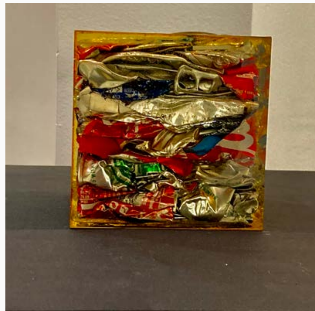
G-Cube 1/100 Harald Reichenbach Cubo de basura de mar en resina 10 cm x 10 cm x 10 cm $ 4 MM 2019