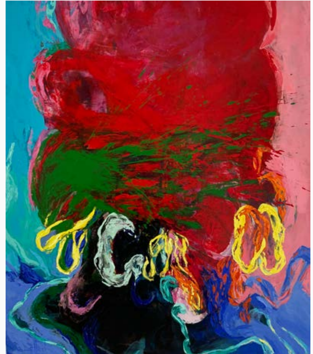
Sin título Walbert Pérez Óleo sobre lienzo 150 cm x 130 cm $13 MM 2019