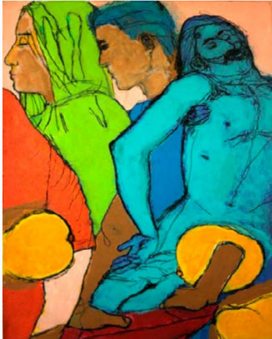
Pensando en mis hijos Celso Castro Óleo sobre tela y marcador $ 30 MM 45 cm x 35 cm 2019