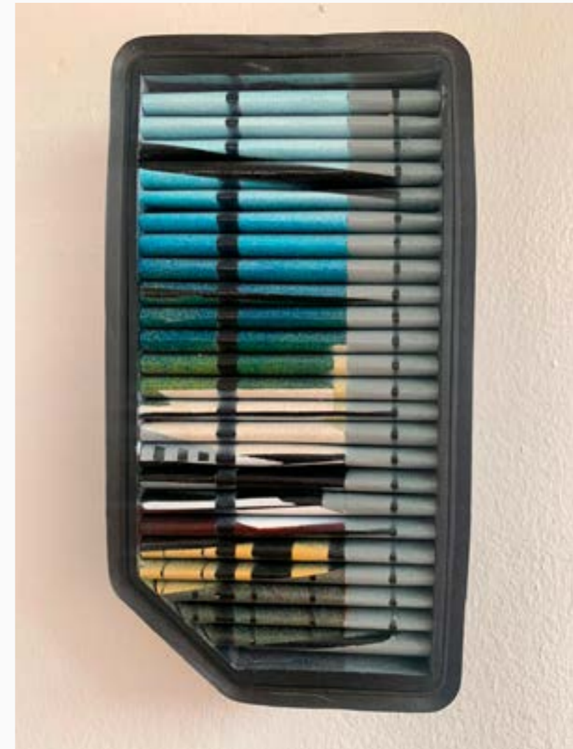
Vista a través de la ventana V Martha Rivero 25 cm x 15 cm Tinta acrílica sobre tela de filtro $ 2,5 MM 2023