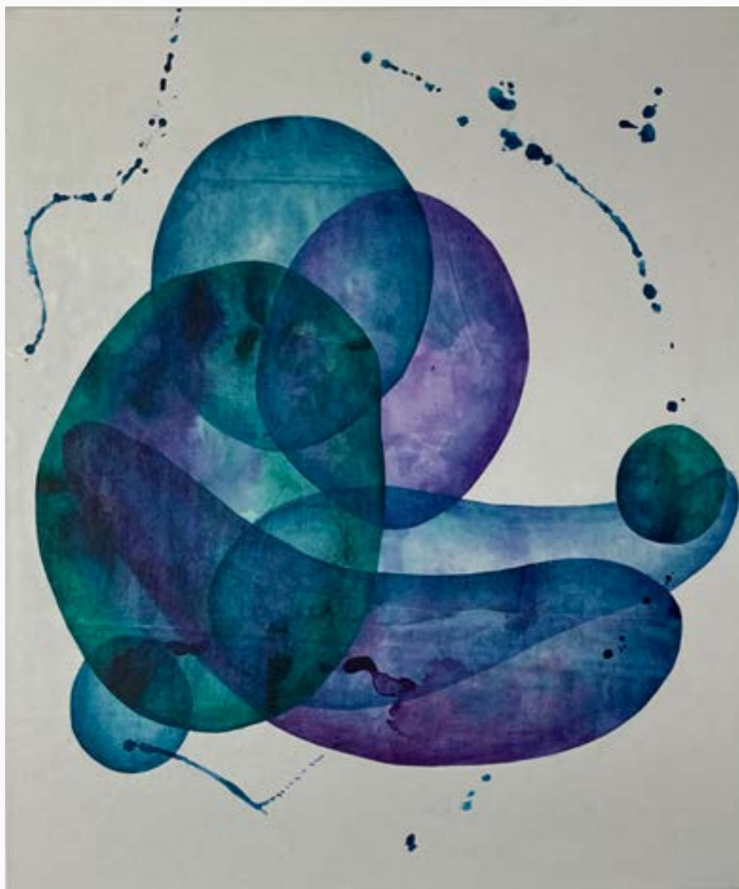
"Serie Serendipia" #4 Claudia Serrano Zv Acrílico sobre lienzo 100 cm x 80 cm $ 4 MM 2023