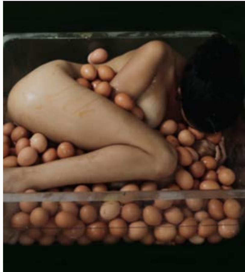
De la serie El día de la cosecha Elsy Arango Video Arte Duración 3`36” $ 2 MM 2022