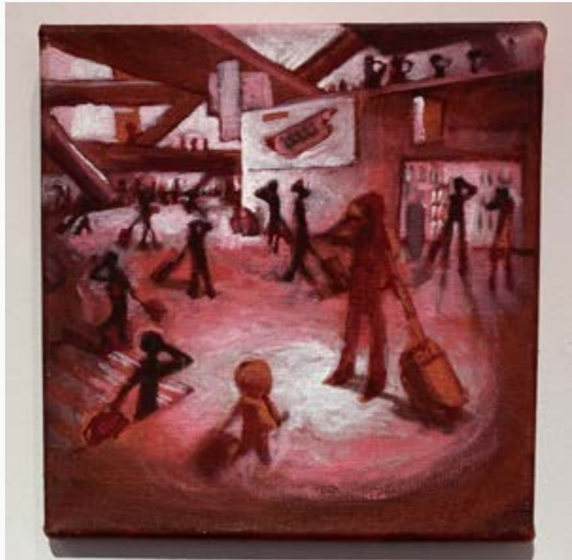
Le petit Nicolas Bernieré Óleo sobre tela 30 cm x 30 cm $ 3 MM 2015