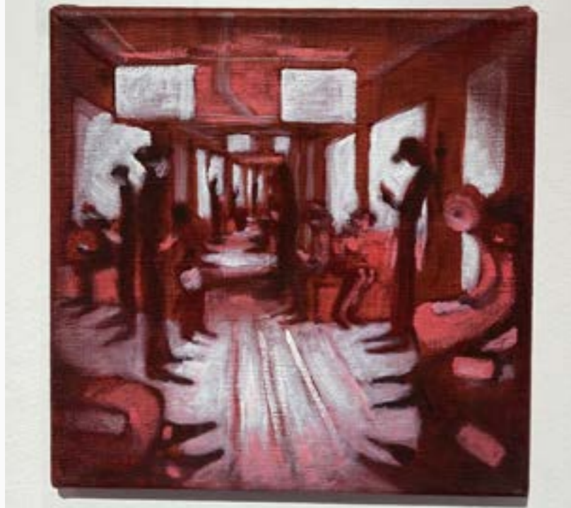
Le petit II Nicolas Bernieré Óleo sobre tela 30 cm x 30 cm $ 3 MM 2015