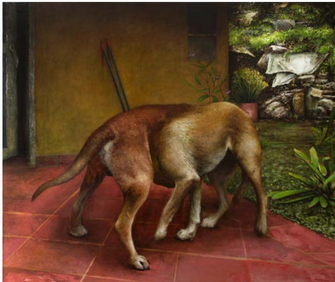
Ouroboros Juan Camilo Barón Óleo sobre papel 100 cm x 120 cm $ 11 MM 2019