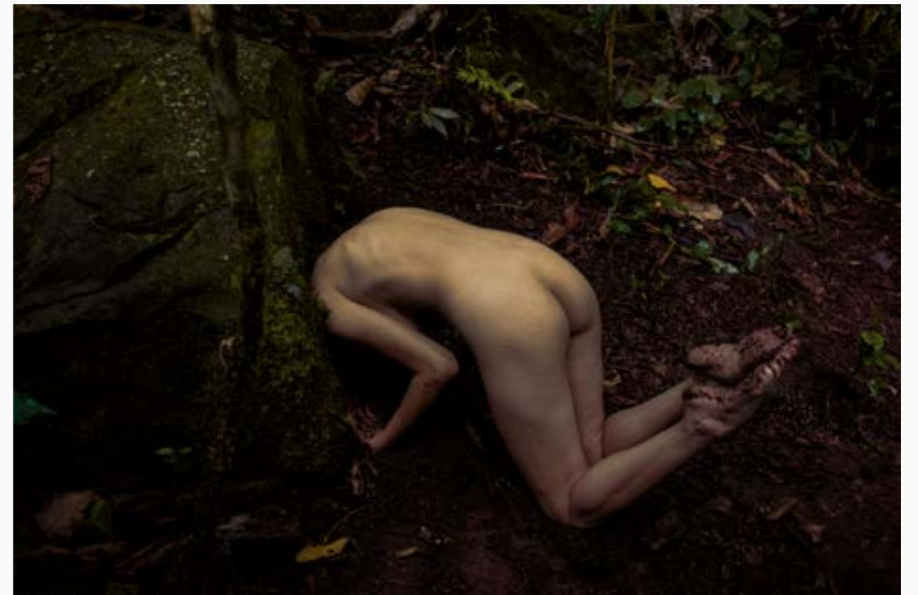
De la serie Exánime Elsy Arango Impresión digital sobre papel de fibra de algodón 100 cm x 150 cm $ 5 MM 2022