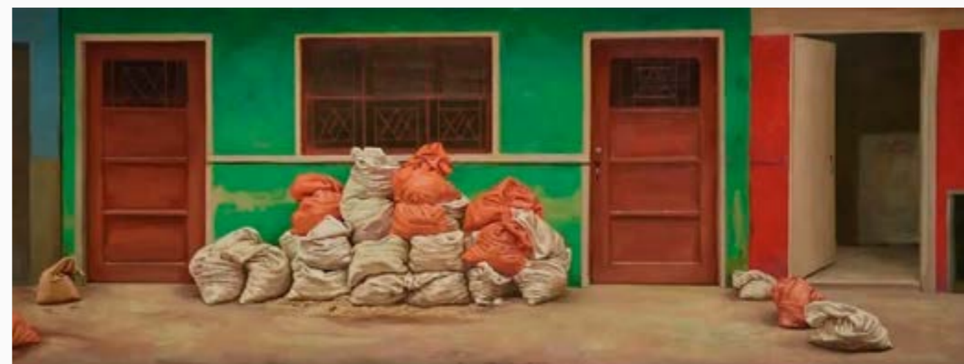
Mirada I Angie Vega Óleo sobre lienzo 65 cm x 175 cm $ 15 MM 2022