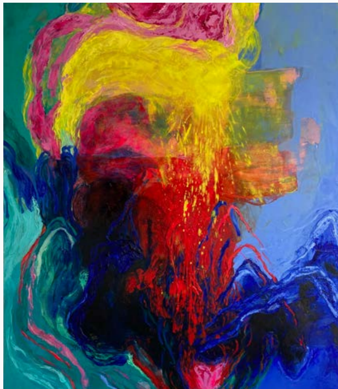
Sin título Walbert Pérez Óleo sobre lienzo 150 cm x 130 cm $13 MM 2019