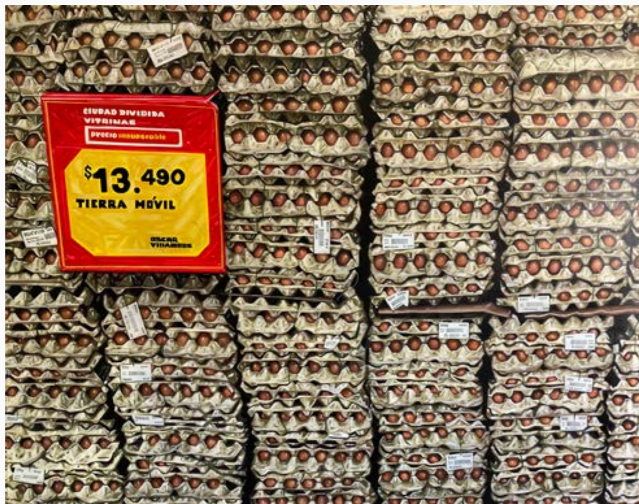
Vitrinas tierra movil Oscar Villalobos Acrílico sobre lienzo 120 cm x 150cm $16 MM 2023